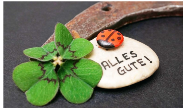
Ute Plötz, MWS ■

Am Ende: Für die schriftlichen Abiturarbeiten in Chemie, Bildender Kunst, Musik, Französisch und Spanisch wünsche ich den Abiturientinnen alles Gute und viel Erfolg!